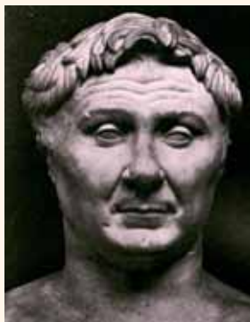
Pompeius de Grote

Toen de Romeinse generaal Pompeius Jeruzalem succesvol binnenviel in de eerste eeuw voor Christus, was hij vastberaden om zijn nieuwsgierigheid aangaande bepaalde verhalen, die de ronde deden in het Middellandse Zeegebied, betreffende de godsdienst van het Joodse volk, te bevredigen. Na het veroveren van deze stad stelde hij het tot één van zijn persoonlijke doelen om de Tempelberg te beklimmen om de waarheid te achterhalen voor wat betreft de raadselachtige verhalen dat het Joodse volk geen fysiek beeld of afbeelding van God had in hun meest heilige plaats van aanbidding, het Heilige der Heiligen.